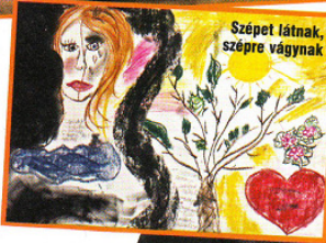
Szépét látnak, szépre vágnak

a nyugdíja, de cukorbeteg és ízületi bántalmakkal küszködik, akkor legalábbis közvetetten veszélyeztetett állapotban van. Nem tud lemmenni az orvoshoz, vagy hogy a gyógyszerét kiváltta, a diétát sem képes megtartani. Akár meg is halhat, vagyis segítségére van szüksége. Ehhez képest, ha felfedezi valaki a bajt, bekerül a belgyógyászatra, onnan esetleg a pszichiátriára, azzal, hogy zavart. Hát hogyan lenne az? És akkor ott van, amíg a jó érzésű doktor „el tudja dugni”, de nem ez a megoldás – mondja Kassai-Farkas doktor. – A szociális otthon sem jó, mert az idős ember kiszakítjuk eredeti környezetéből, gyökértelessé tesszük, és ez mentális sokkot okoz neki. Minden ápolásra szorulóknak az a legjobb, ha a megszokott holmija, bútorai között maradhat, különben nem várujuk csodát. Menjen oda valaki minden nap, vásároljon, amit kell, tegye rendbe a környezetét, és maradjon vele, hogy kicsit együtt legyen valakivel,