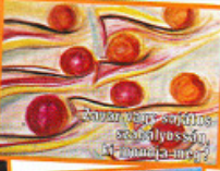
Ha egyszer a depresszió az új

– Ahhoz, hogy a közérzetünk jól legyen, nem kell mindig nyerni,