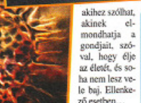
Alkoholvirus, ahogy ok-latjuk